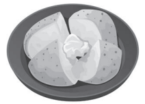
ふかしじゃがいも